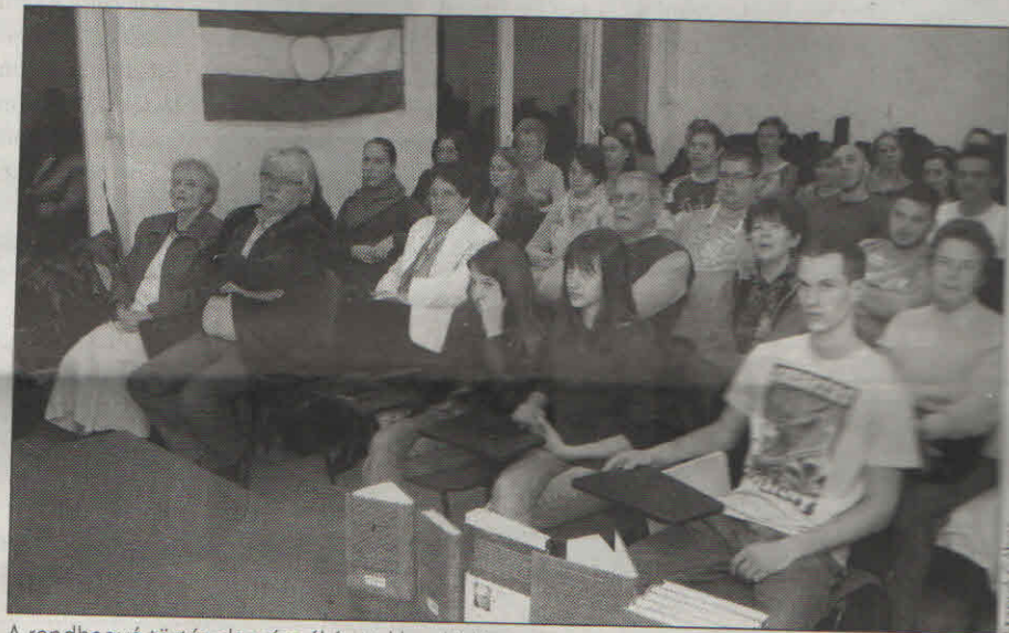
A rendhagyó történelemóra áhítattal kezdődött