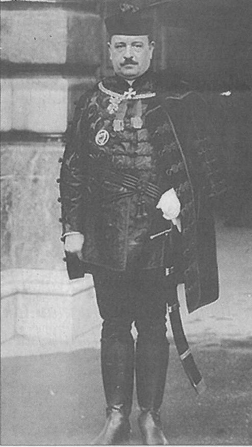
Hóman Bálint díszmagyarban

kor népbiztoshelyettesként és a Vörös Hadsereg politikai biztosaként tevékenykedett, Hóman viszont végleg háttérbe fordított korábbi, nemzeti liberális elképzeléseinek, és konzervatívává vált. A keresztény magyar közép-osztály nagy részéhez hasonlóan ő is osztotta azt a véleményét, miszerint a zsidóság – amely a sajátos magyar társadalomfejlődés következtében a XIX. század végére a gazdaságban és a kultúrában erős felülreprezentáltságot élvezett – 1919-ben már a politikai hatalmat is igyekezett megkaparintani. A friss tapasztalatok és az ezek nyomán túltengő érzelmek miatt Hóman és mások sem mérlegelték, hogy az általánosan „zsidóuralomnak” vélt Tanácsköztársaság vezetőinek többsége az internacionalizmus jegyében saját hitét és zsidóságát is megtagadta. Mindenesetre túlbuzgó kritikusan jól tennék, ha személyiségét és tevékenységét megismernék, és kevésbé egysíkúan, nem pusztán érzelmi attitűddel közelítenének hozzá; ha tanulmányoznák Hóman életének és munkásságának más oldalait is a működését egyébként sem meghatározó antiszemitizmuson kívül.