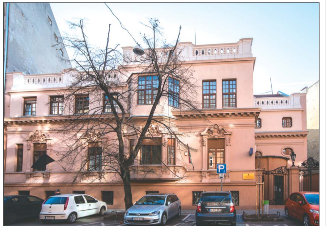
Kívülről már teljesen megújult a szakrendelő

- Úgy gondolom, hogy a második vagy harmadik negyedévben. Jelenleg az előkészítés zaj-