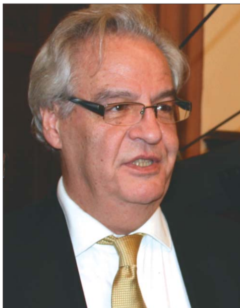
Maros Miklós zeneszerző

A Budavári Önkormányzat a Beethoven Budán Fesztivál keretében idén első alkalommal hirdetett zeneszerzőversenyt. A pályázók feladata Beethoven A távoli kedveshez című dalciklusa által ihletett zenei variáció vagy parafrazis elkészítése. A versenyre március 14-ig várják a műveket. A 6000 euró összdíjazású versenyről Maros Miklós Svédországban élő zeneszerzővel, a zsűri elnökével beszélgettünk.