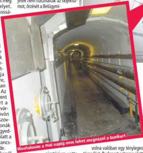
Hivatalosan a mai napig nem lehet megnézni a bunkert

nisztérium vette át. Megkapta az úgynevezett BBS (Bombabiztos, Gázbiztos és Szilánkbiztos) minősítést, majd az A (azaz Atombiztos) jelzést is – avat be a bunkertűrákat szervező Budapest Scenes. Azt nem tudni, kibirt