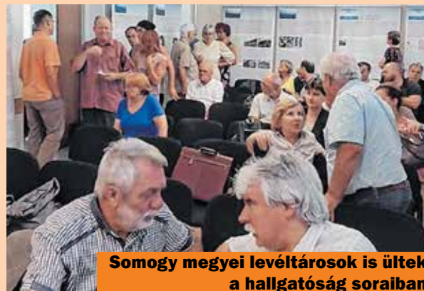
Somogy megyei levéltárosok is ültek a hallgatóság soraiban