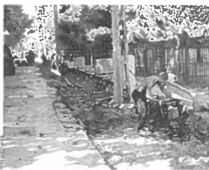
Pénteken még folyt a munka a Diénes iskola előtt parkoló kialakításán

ezek ellen hogy védekezhetnek, de fontos az is, hogy a gyerekek elkövető se váljanak. Számtalan olyan visszatérő téma van, amelyekkel foglalkozni kell, az ismereteket nem árt felfrissíteni. Ilyen például a kalitkaeszer fogyasztás megelőzése, a biztonságos közlekedés, a vagyonvédelem, iskolai erőszak, az internet veszélyei vagy az ünnépek. Az eddigi tapasztalatok szerint valamennyi témában érdeklődtek és beengedtek voltak a tanárok és gyerekek. Sokszor már annak is örültek az iskolákban, hogy a tanárok és a gyerekek egy igazi rendőrrel beszélhettek mindennapi problémáikról, foglalkozott a sajtószóvivő. ■ I. I.