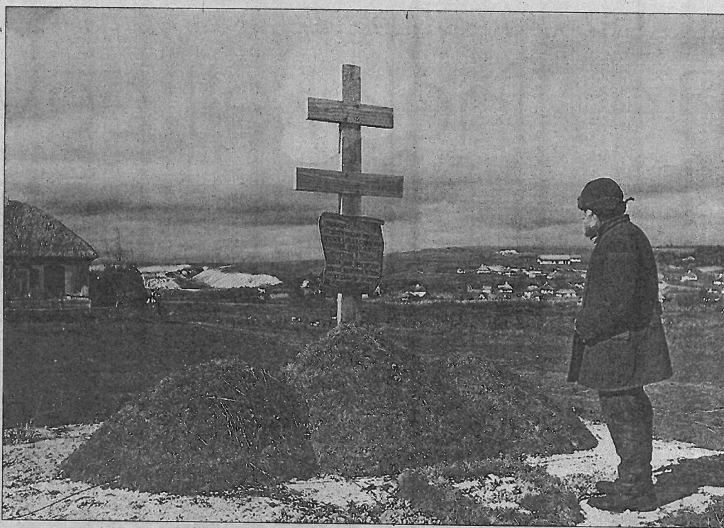
Hármas halom az orosz fronton magyar és orosz nyelvű táblával, 1942

– Jány vezérezredes „hírhedt” hadseregpáncsának előzménye és körülményei nem ismer-