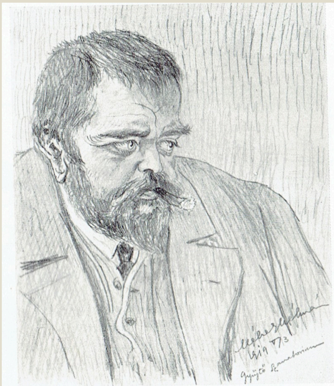
A kőbányai gyűjtőfogházban 1919 V. 3-án készült karikatúra.