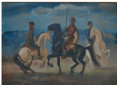
Kurucok - borsai freskóterv