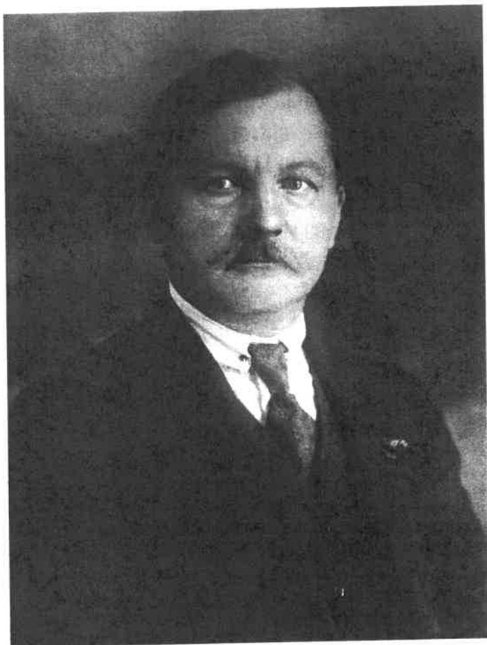
41. Farkas István szociáldemokrata képviselő 1922-ben

sával egyre fogyatkozó Magyarországi Szociáldemokrata, majd később Szociáldemokrata Párt nemzetgyűlési, illetve országgyűlési frakciójának meghatározó egyénisége, 1931-től vezetője; emellett 1925-től 1931-ig a főváros törvényhatósági bizottságának is tagja, 1928–1931 között pedig a Népszava szerkesztője volt. A képviselőségét elvesztett Farkast a német megszállás után a Gestapo letartóztatta, Dachaubá vagy Auschwitzba hurcolták, ezutáni sorsa nem ismert (valószínűleg 1944 végén vagy 1945 elején halt meg).