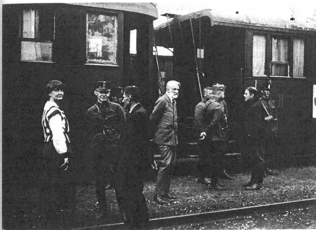
45. Andrassy Gyula gróf (középen) IV. Károly vonata előtt, 1921

rály mellett – a vádhatóság elkülönítette. 75 A vádemelést követően az ügyészség elnöke az ügy iratait továbbította Kiss István táblabíró által vezetett vádтанácsnak, mivel a Bp. 98. §-a szerint neki kellett határozatot hoznia a vádlottak további fogva tartásának kérdésében. A védelem is a vádтанácshoz fordult a terheltek szabadon bocsátása érdekében.