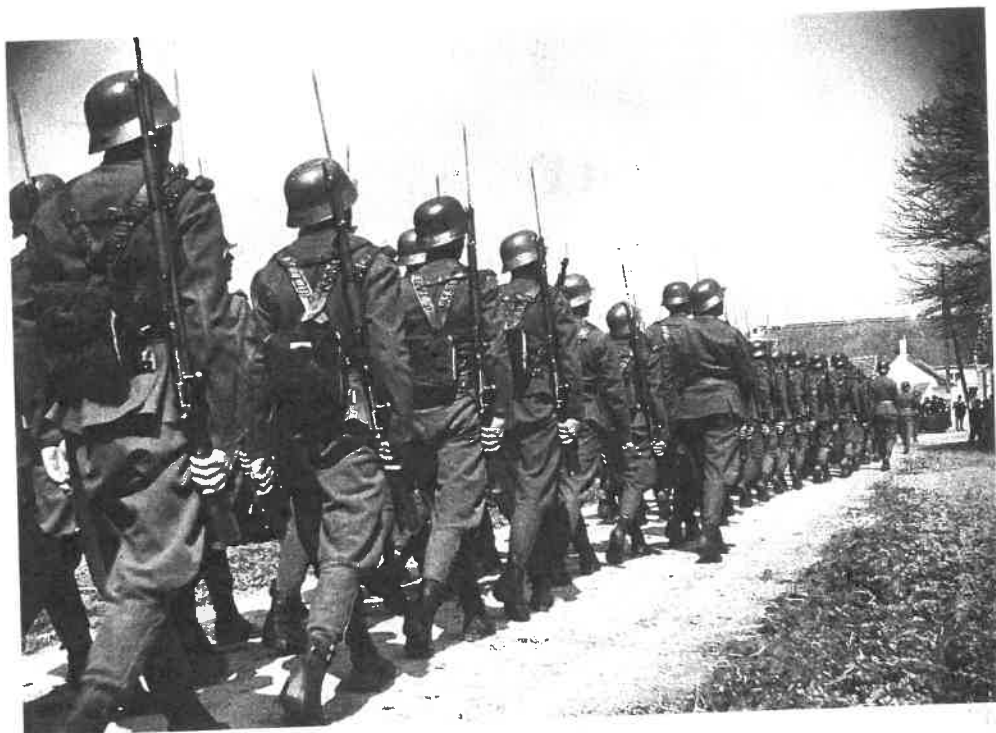
59. Magyar katonák bevonulása Délvidékre, 1941

négyzetkilométernyi terület 55 százalékát, azaz 11 475 négyzetkilométernyi területet kapott vissza (Bácska, Baranya déli területei – az úgynevezett Baranyai háromszög, Muravidék és a Muraköz). A magyar várakozásokkal ellentétben az 1920 és 1941 között az első délszláv államhoz tartozó Bánát/Bánság azonban a német megszállás alatt álló szerb bábállam része lett. 2