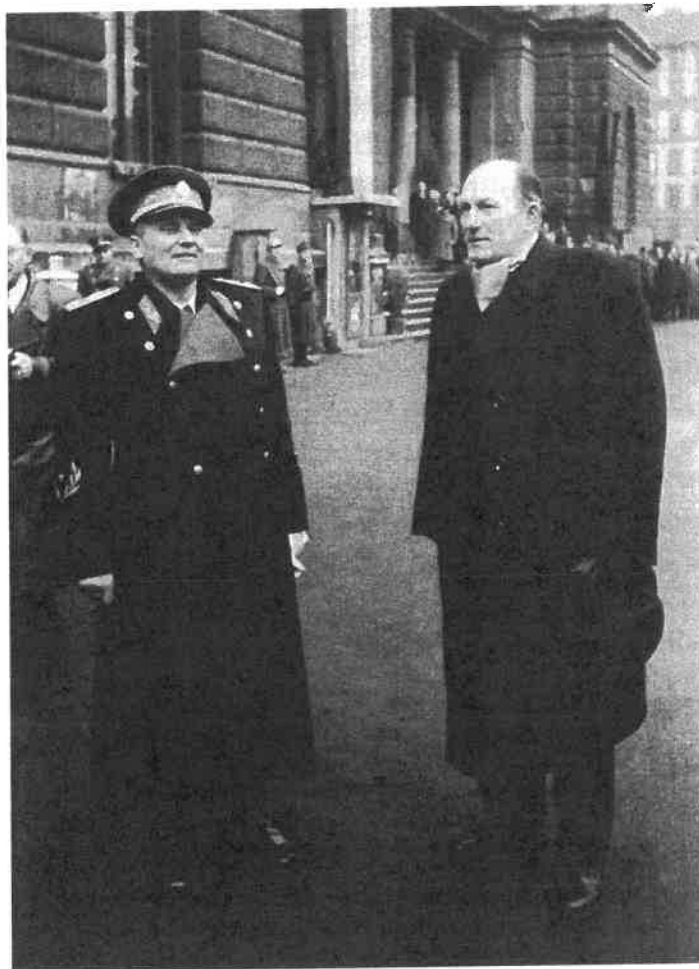
62. Josip Broz Tito és Dinnyés Lajos miniszterelnök a Keleti pályaudvar előtt 1947-ben

belügyminiszter 1945. november eleji belgrádi útja teremtette meg. 91 Erdei azért utazott a jugoszláv fővárosba, hogy kapcsolatot teremtsen a jugoszláv politikai közigazgatási hatóságokkal, s konkretizálja az adategyeztetésre vonatkozóan a Magyarország és Jugoszlávia közötti együttműködést mindazon egykori magyar rendőrökről, csendőrökről, kémelhárító tisztekről, valamint a magyar érában szerepet játszó személyekről, akik a háború után az akkori magyar állam területén tartózkodtak. Annak ellenére, hogy a két ország között komoly feszültségek is keletkeztek amiatt, hogy Magyarország több esetben vonakodott a háborús bűnökkel megvádolt személyeket kiadni – lásd a későbbiekben Vojnits