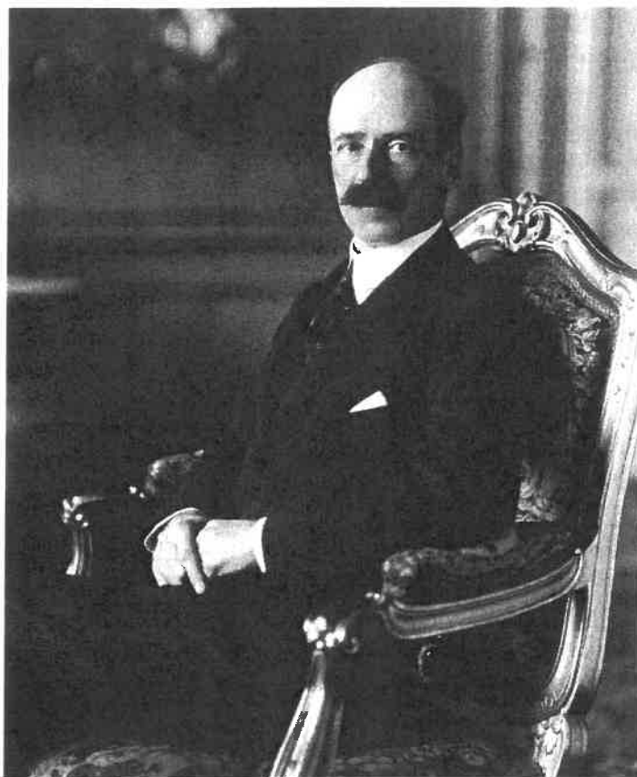
40. Bethlen István gróf miniszterelnök, 1920-as évek eleje

belügyminisztere, Klebelsberg Kuno másfél hónap alatt készítette el az új választójogi törvényjavaslatot, melyet 1922. január 24-én a minisztertanácsnak, majd 27-én a nemzetgyűlésnek is bemutatott. A parlament összetétele, legnagyobb pártjának, az Országos Kisgazda- és Földműves Pártnak az álláspontja azonban kérdésessé tette, hogy elfogadják-e az 1920-ban érvényes választójog megnyirbálását.