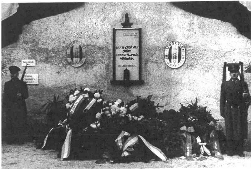
48. Bajcsy-Zsilinszky Endre emléktáblája a sopronkőhidai fegyház udvarán, 1948

A szervezkedést az államrendőrség 1940. július 25-én leleplezte, és – miután a képviselőház Wirth mentelmi jogát „az előzetes letartóztatást is magánbanfoglaló hatállyal” felfüggesztette (az erről szóló jelentés 1940. november 7-én készült el, és másnap szavazták meg) 113 – november 11-én letartóztatta. A budapesti büntetőtörvényszék 1940. december 21-én Wirthet négy és fél évi, társait ennél rövidebb fegyházbüntetésre ítélte. Ez az ügy is a Kúria elé került, amely 1941. január 31-én Wirth Károly büntetését tizenöt évi fegyházra emelte föl.