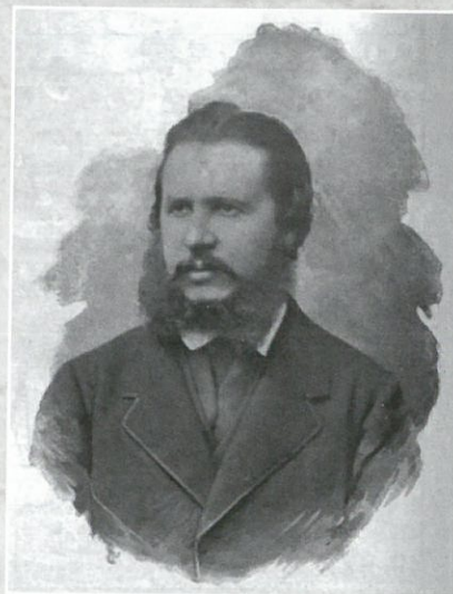
A fiatal Széll Kálmán

A két Széll fiú gyökeresen eltérő személyisége további magyarázattal szolgál az eltérő pályáivékra. A Széll Kálmánról készült kortárs jellemzések nagyjából ugyanazt a képet mutatják: jóképességű politikus, aki megnyerő, konciliáns, előzékeny és kifinomult, ugyanakkor agilis és céltudatos. Másrészt viszont nagyon (olykor a neveltségesség határát súrolóan) hiú, önmagát középpontba helyező jellem volt. „Csak azokat kedvelte igazán, akik éreztették vele, hogy őt minimum második Deák Ferencnek tartják” – írta róla egyik kortársa. A Deákkal való összevetés azért is érdekes, mert sokkal inkább a fiatalabb testvér felelt meg a „deáki” archetípusnak. A zárkózott, reflektorfényt kerülő Széll Ignácot a végtelen egyszerűség és a puritanizmus jellemezte, viszont mindig nyílt (olykor kissé nyers) volt, emellett szűkebb szakterületében (a közigazgatás terén)